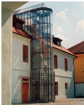
Moderně vybudovaný výťah bývalé hospodářské budovy dobře architektonicky spojuje staré s novým.