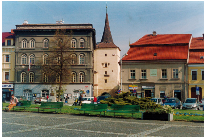
Budova radnice královského města Slaný s Velvarskou bránou.