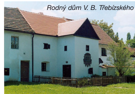
Rodný dům V. B. Třebízského

Na skále je pomník V. B. Třebízského, odkud za pěkného počasí se otevírá široký rozhled do kraje s Českým středohořím na obzoru.