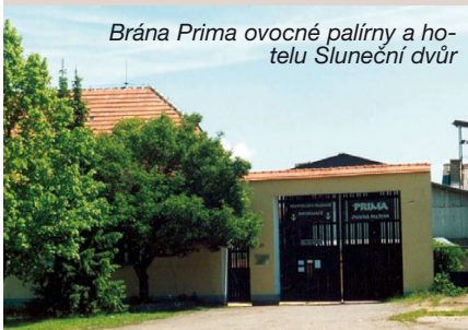
Brána Prima ovocné palírny a hotelu Sluneční dvůr