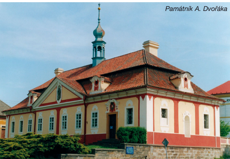
Památník A. Dvořáka

Železniční muzeum Zlonice, Tyršova 444 273 71 Zlonice, Tel.: 602 122 052