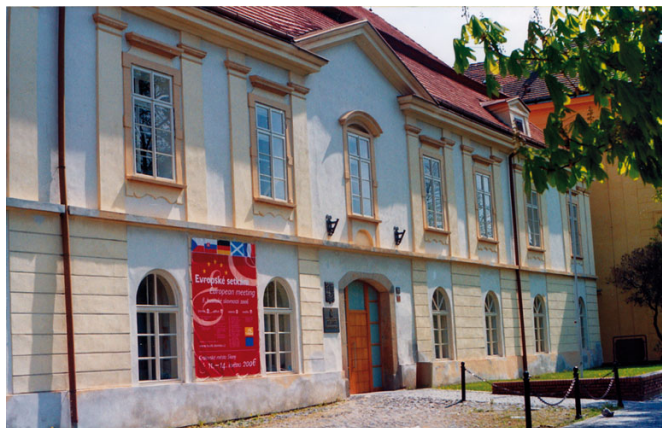
Budova staré pošty se přeměnila po rekonstrukci na moderní část radnice.